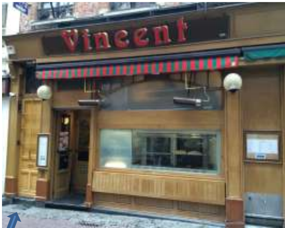
ingang naar gang

LEVEREN: op woensdag tussen 7h00 en 11h00