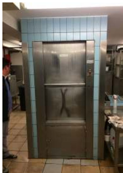
lift: keuken → restaurant